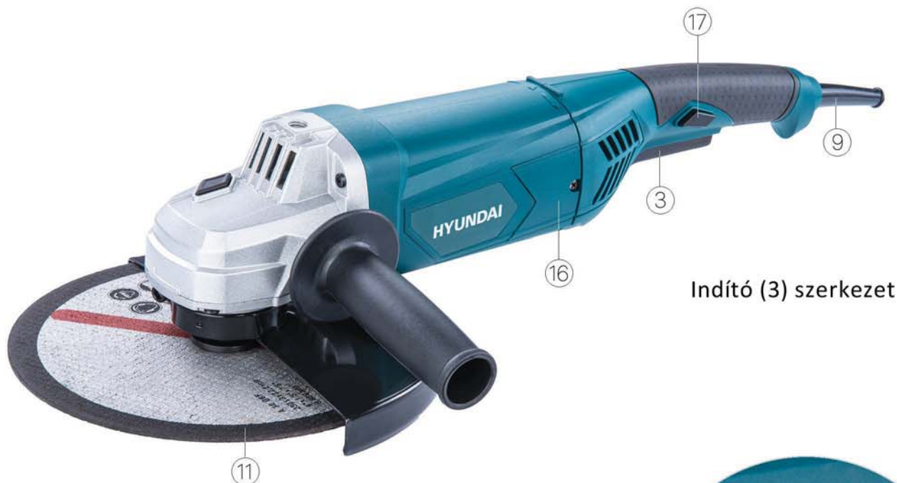
Indító (3) szerkezet

Emelje fel a rugót (19) a szénkefe (15) cseréhez (14)