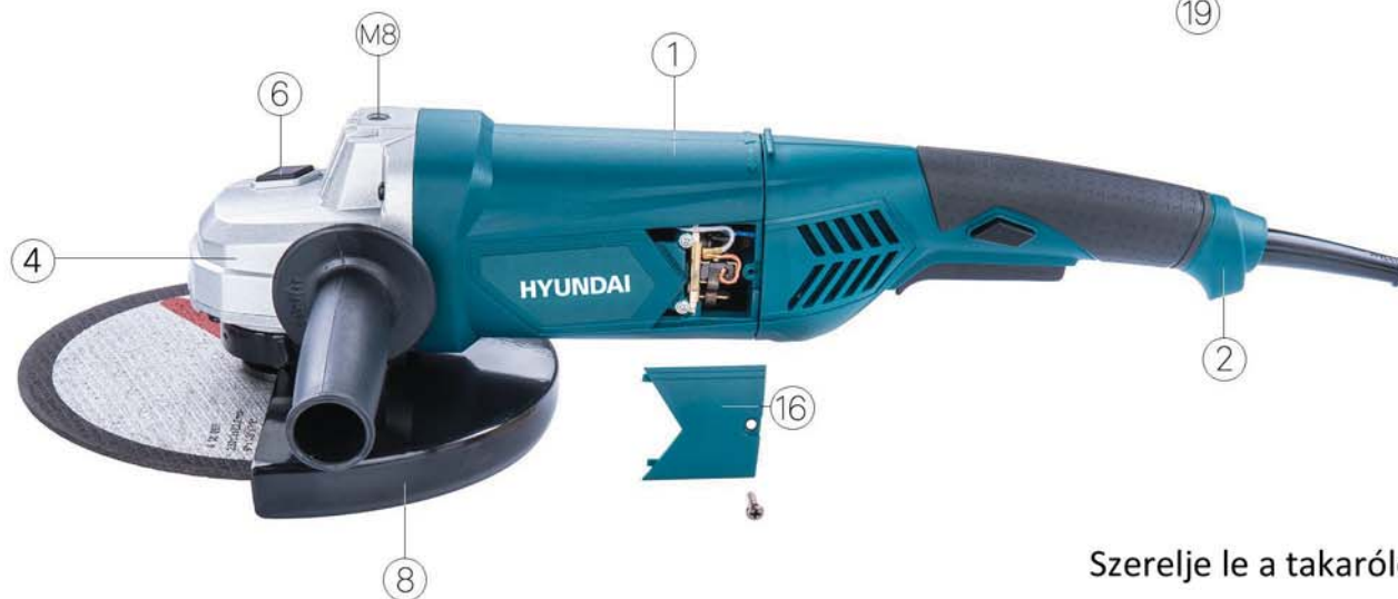
Szerelje le a takarólemezt