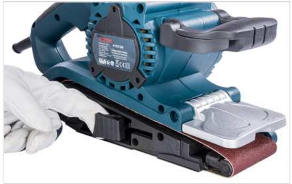
A szallagfeszítő kar nyitása