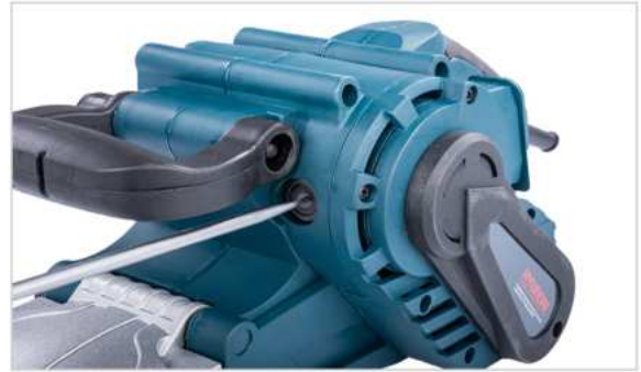
A szénkefe szorító kicsavarása