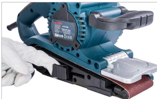
Fül kinyitása (a csiszolószallag fellazítása)