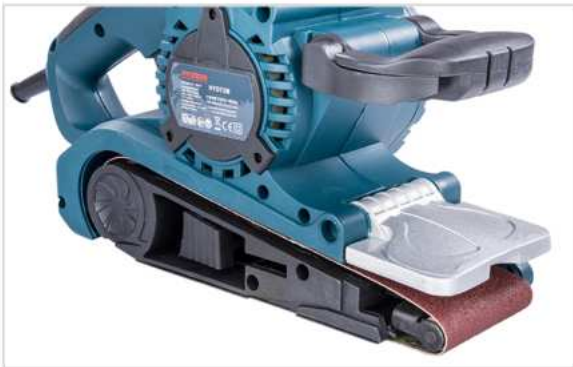
A csiszolószallag feszítés aktív