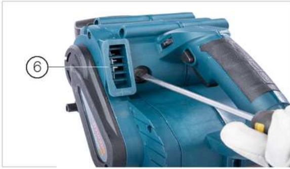
A porzsák csatlakozó helye