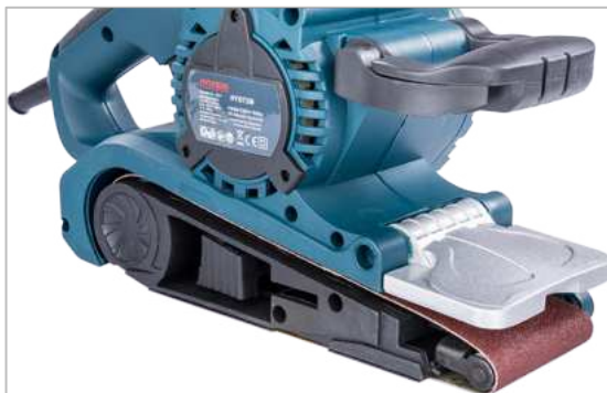
Fül zárva (a csiszolószallag feszes)