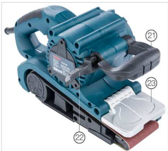
Az első markolatrögzítő kar nyitva