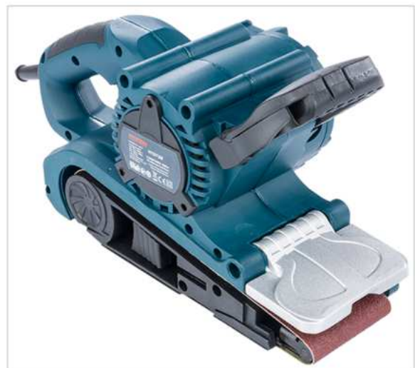
Az első álltható fogantyú középső állás